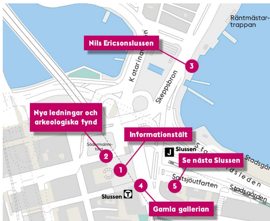
Exempel på enkel karta i stadens manér med tillagd information

Kommunikatörer och andra tjänstemän inom staden kan själva enkelt och enhetligt producera enklare kartor. Även kommunikationsbyråer ska utifrån denna manual veta hur de får tag på kartunderlag samt vilka riktlinjer som gäller när kartan är informationsbärare.